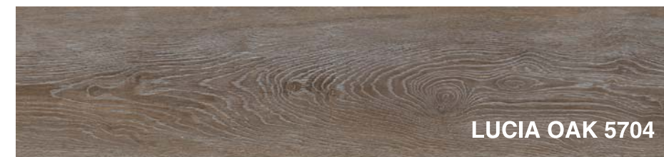
LUCIA OAK 5704