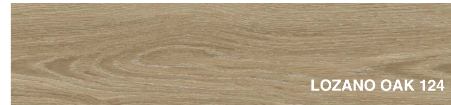
LOZANO OAK 124