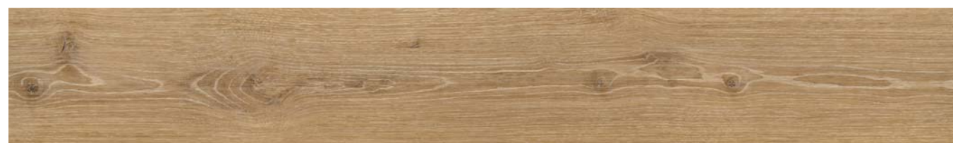
LAGOON OAK 003-3