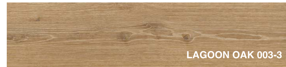
LAGOON OAK 003-3