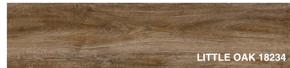
LITTLE OAK 18234