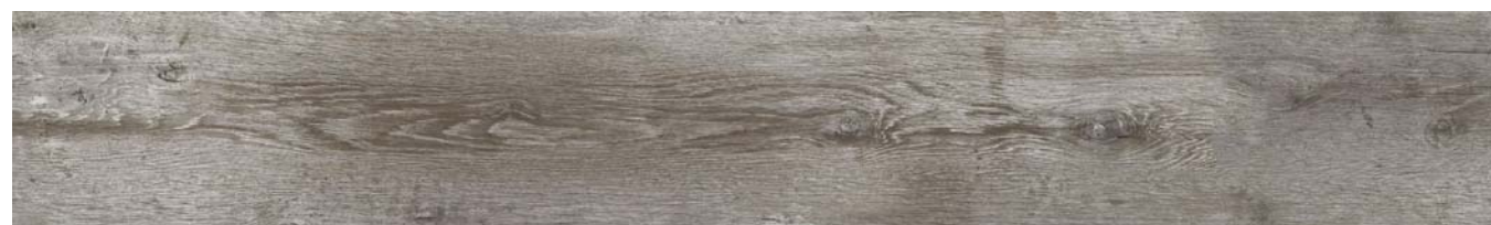
LUDO OAK 4106

Kích thước: 18x122x0.4 cm - Bề mặt: Matt