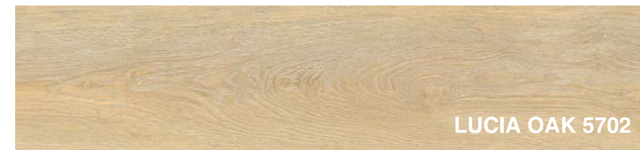
LUCIA OAK 5702