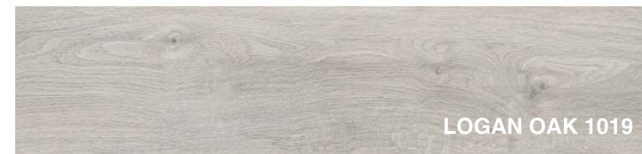
LOGAN OAK 1019