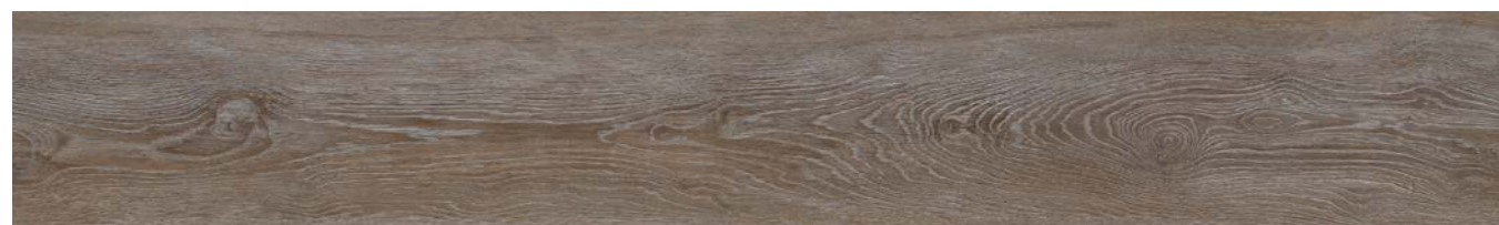
LUCIA OAK 5704