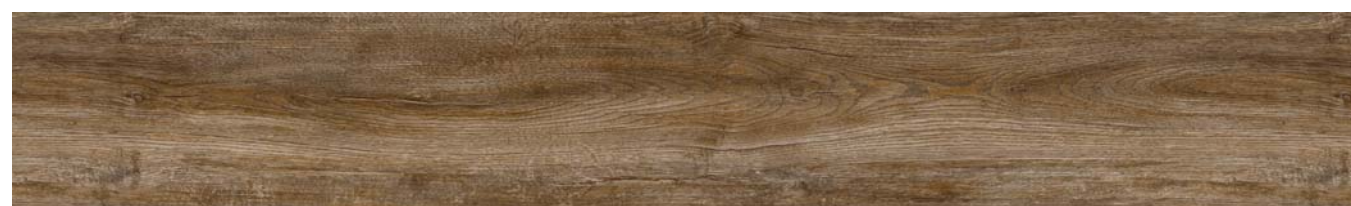
LITTLE OAK 18234