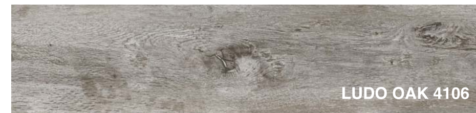
LUDO OAK 4106