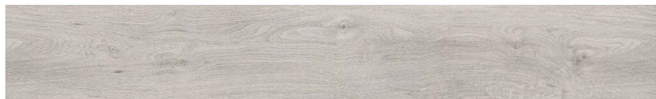
LOGAN OAK 1019

Kích thước: 18x122x0.4 cm - Bề mặt: Matt