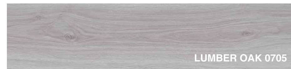
LUMBER OAK 0705