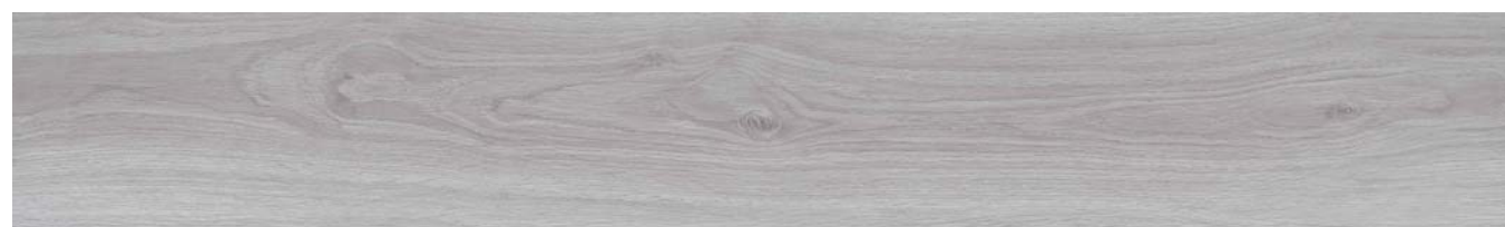
LUMBER OAK 0705