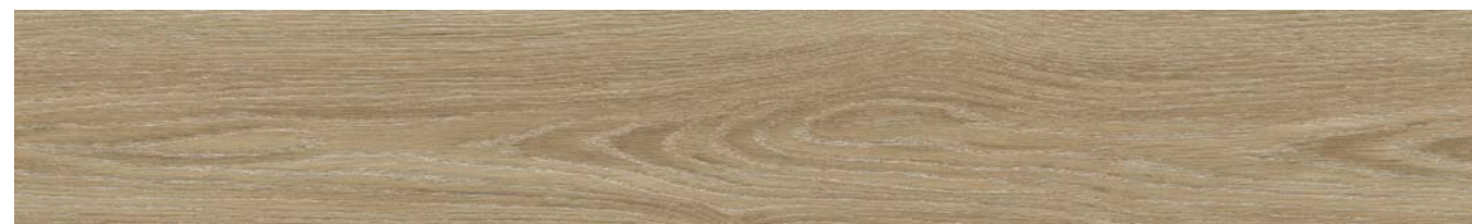
LOZANO OAK 124