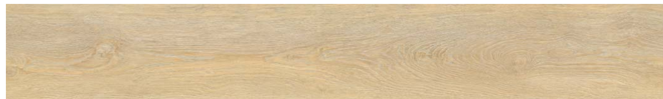
LUCIA OAK 5702